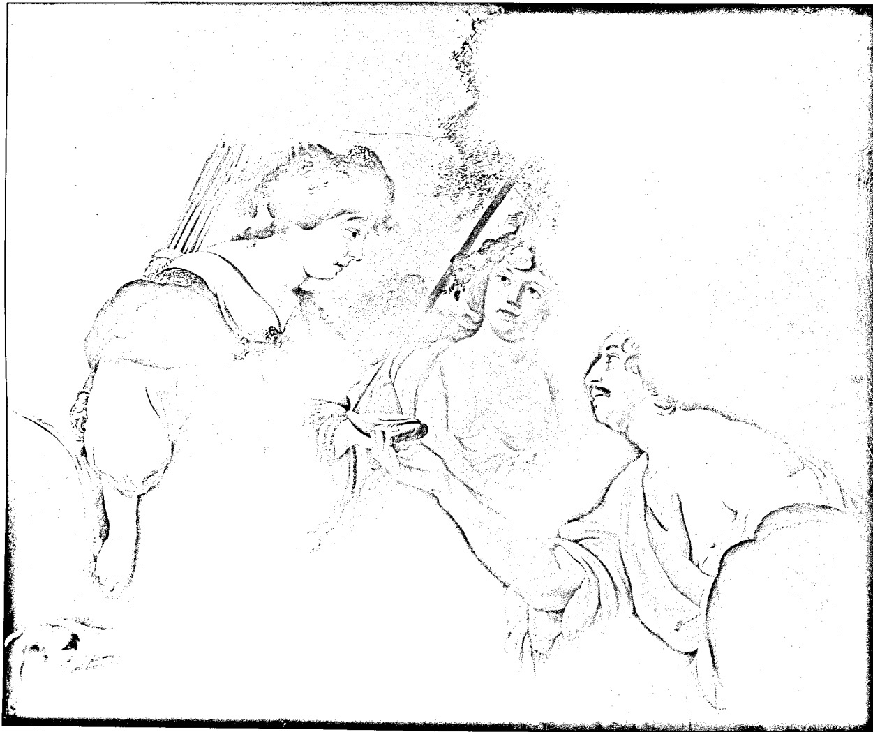
Granida en Daifilo door Jacob Adriaansz. Backer.

wordt diep getroffen door haar verheven voorkomen en laat Granida meteen uit een schelp drinken. Vanaf datzelfde moment heeft de eenvoudige Dorilea voor hem afgedaan en wordt hij beheerst door verliefde gevoelens voor de edele prinses van Perzië.