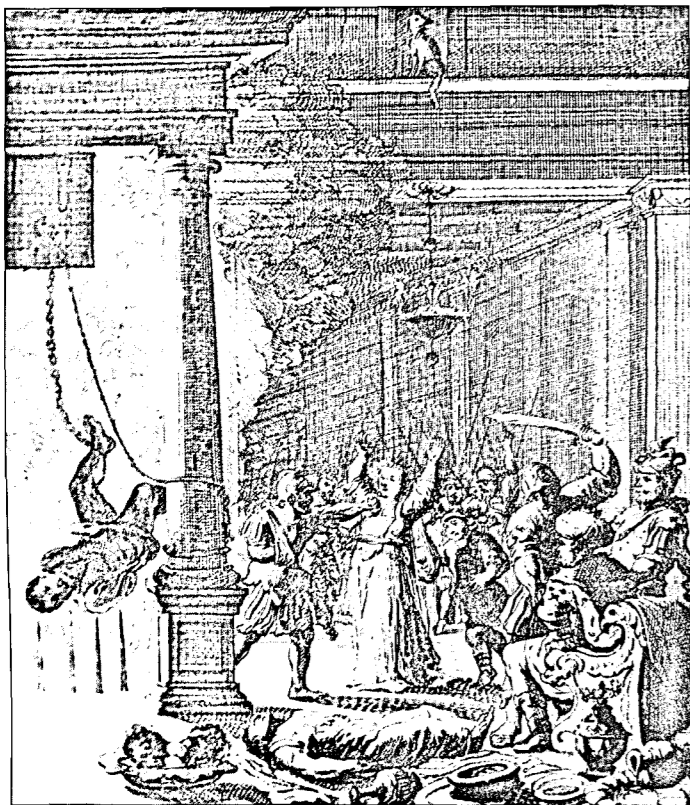
Titelgravure bij Jan Vos' Aran en Titus , Amsterdam, vijfde druk, 1656.

triumfantelijk beider hoofden op een schotel binnen. Het meisje is eerder door de twee broers verkracht en – opdat ze niemand duidelijk zou kunnen maken wat haar is overkomen – door hen van haar tong en handen beroofd. Nu komt het handlingsverloop in een ware stroomversnelling terecht. Om haar lijden te bekorten, steekt haar vader Titus de onteerde Rozelyna dood. Thamera, die voor haar leven vreest, roept de hulp van haar minnaar Aran in, maar hem wacht een jammerlijk einde boven een open vuur. De 'Gotse' troonhoudster wordt dan door Titus gedood. Hij wordt op zijn beurt omgebracht door Saturninus – de keizer van Rome, aan wie Thamera haar liefde heeft toegezegd – die hierop wordt neergestoken door Lucius, Titus' zoon, en diens oom Markus.